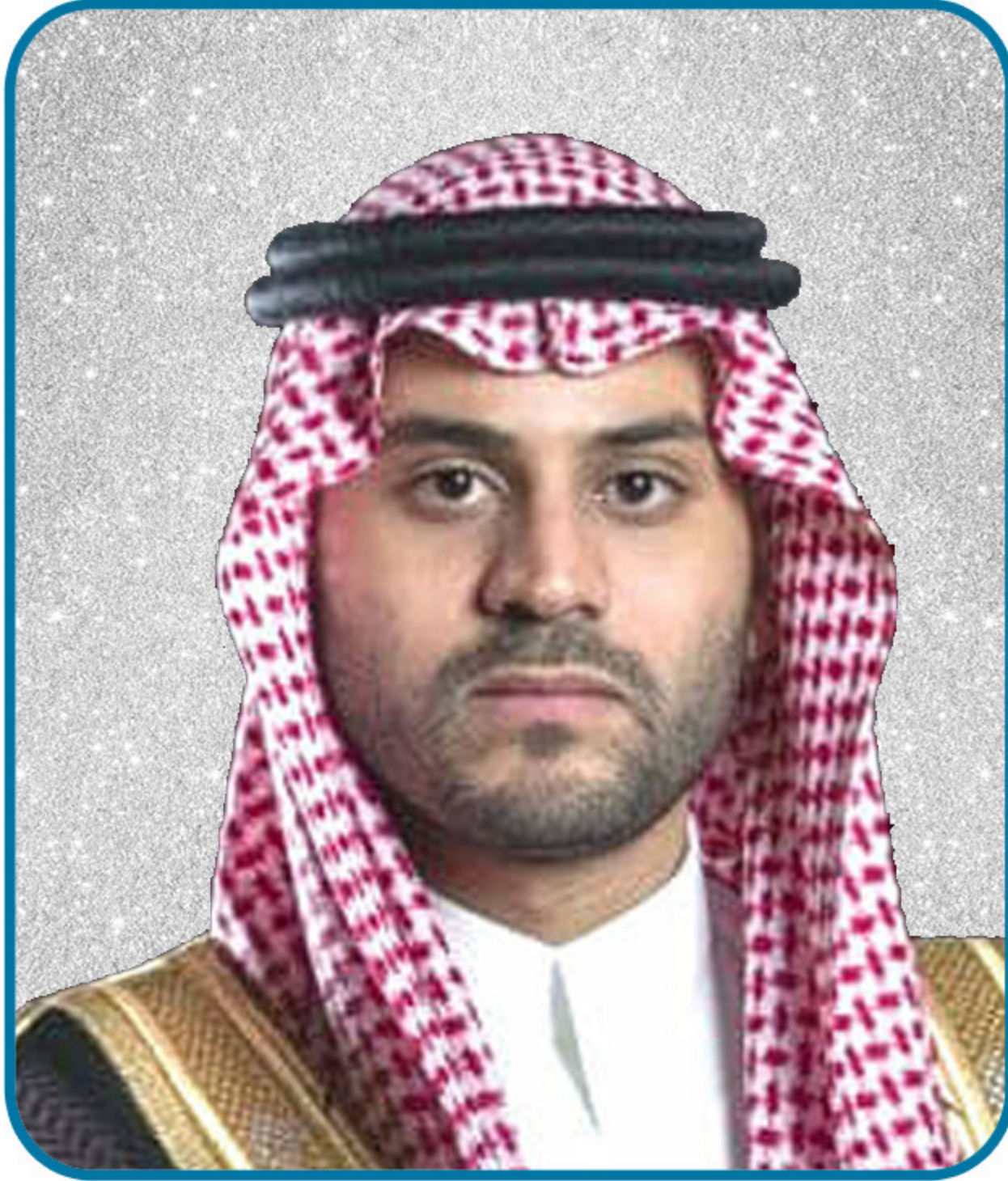
صاحب السمو الملكي الأمير