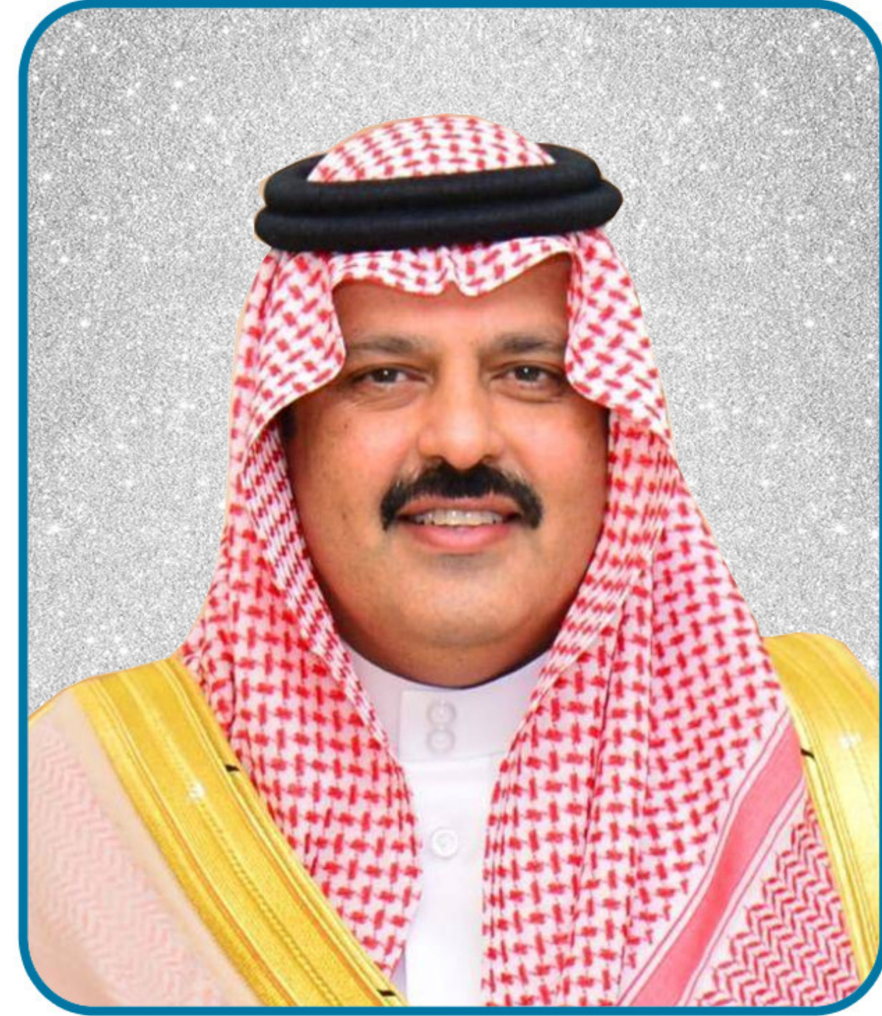
صاحب السمو الملكي الأمير

عبد العزيز بن سعود بن عبد العزيز آل سعود