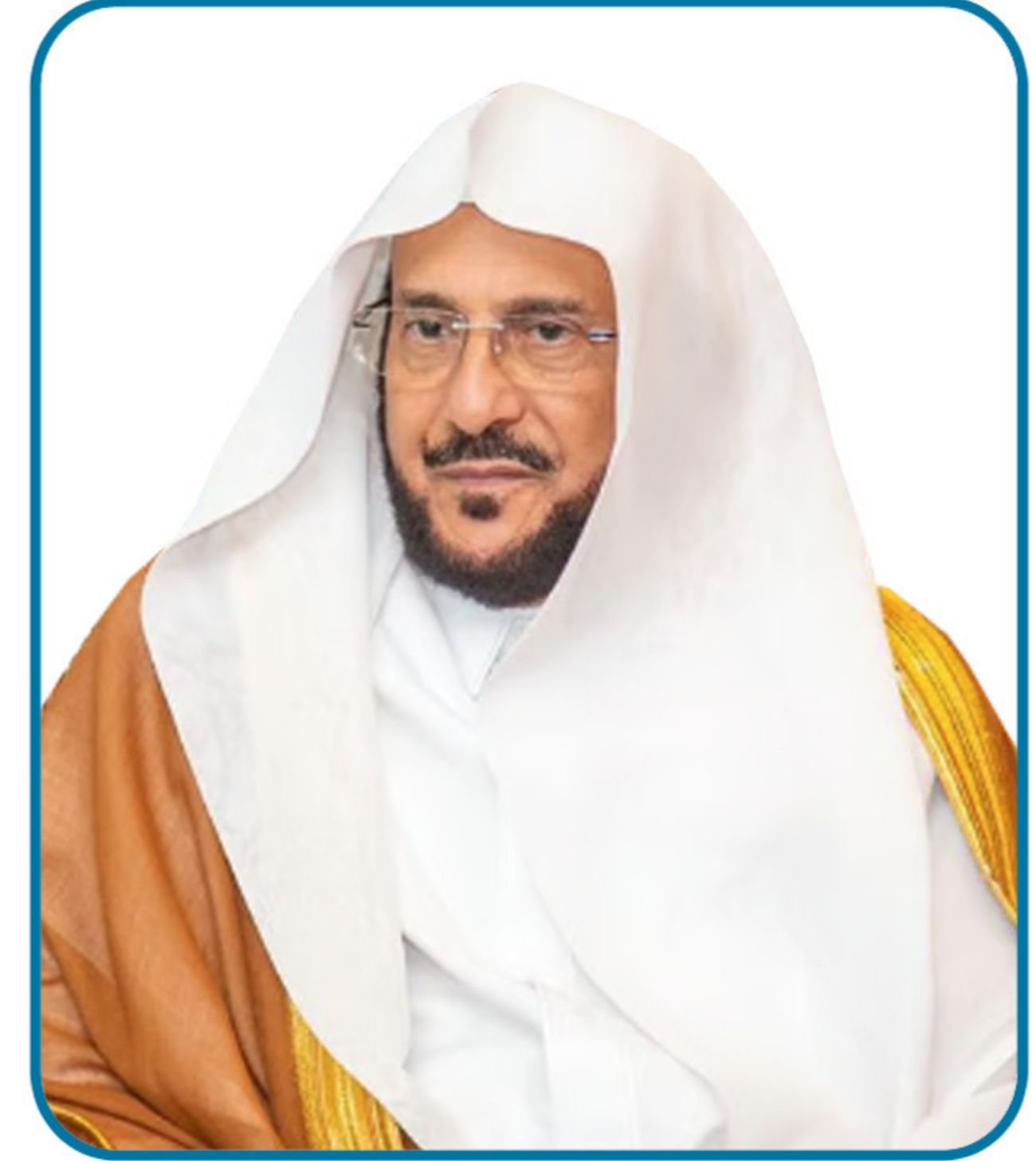
معالي الشيخ الدكتور

أحمد بن سليمان الراجحي وزير الموارد البشرية والتنمية الاجتماعية